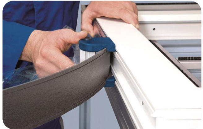
Aanbrengen op een kunststof kozijn, geklemd in de profilering met behulp van de Toolclip