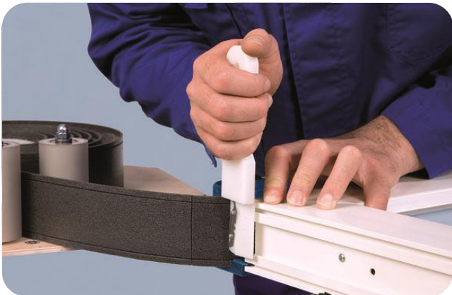
Ter plaatse van hoeken de achterzijde insnijden met de Toolcut