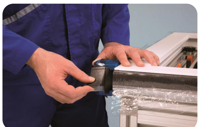
Het verwijderen van het ingesneden gedeelte van de rug van het compressieband