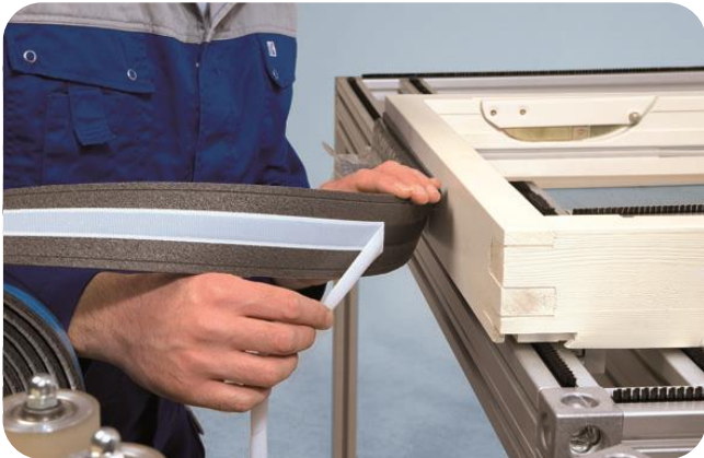
Aanbrengen op een houten kozijn middels de butyllaag, aanvullend vastnieten in de zijstroken