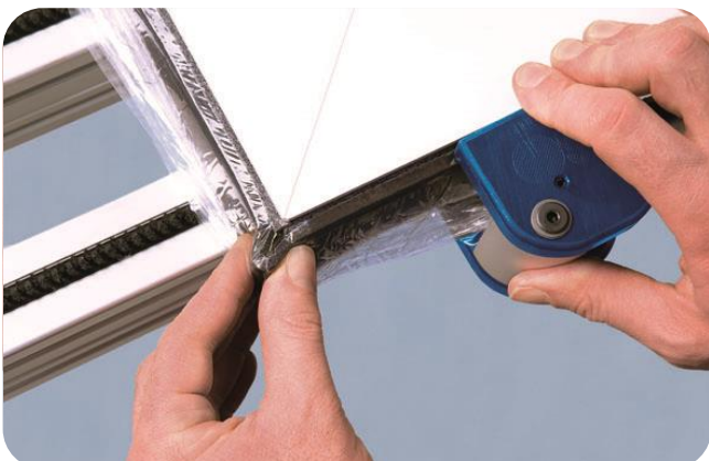
Creëer een lus met het compressieband voor een goede afdichting van de hoeken