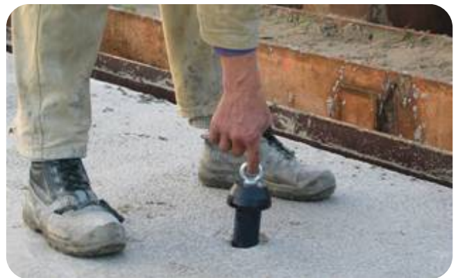
Na uitharding van het beton is de sparingplug met één vinger te verwijderen