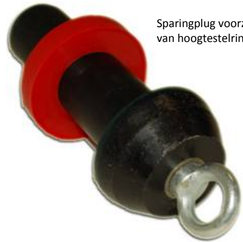
Sparingplug voorzien van hoogtestelling