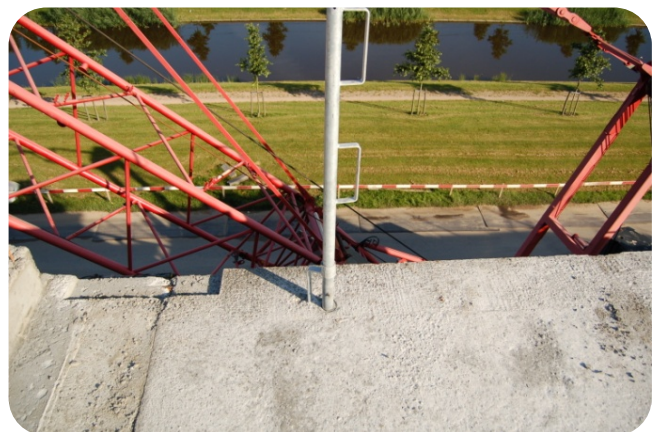
De vloerrandbeveiliging kan in de sparing worden geplaatst