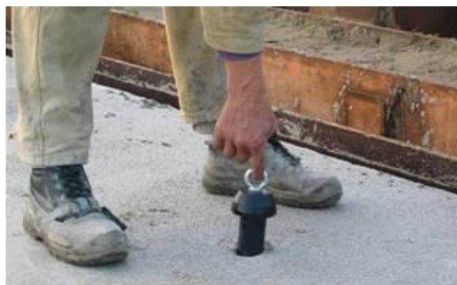
Na uitharding van het beton is de sparingplug met één vinger te verwijderen