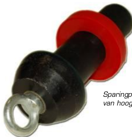
Sparingplug voorzien van hoogte stelring